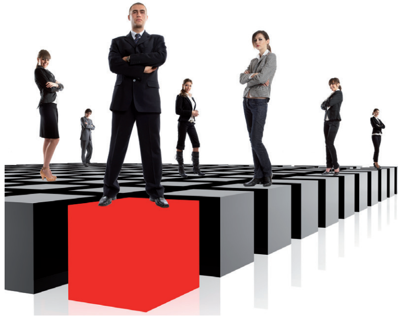
Comprenden la naturaleza de la energía emocional humana.

De este modo, ¿qué otros rasgos tienen en común estas personas, además de su optimismo? Que comprenden la naturaleza de la energía emocional humana. Olvidémonos de la inteligencia emocional, que no es sino comprender las emociones. Necesitamos algo más que eso, es necesario utilizar esas emociones. Debemos desarrollar la capacidad para controlar nuestro propio estado emocional, así como la habilidad para influir positivamente en el estado emocional de los demás.