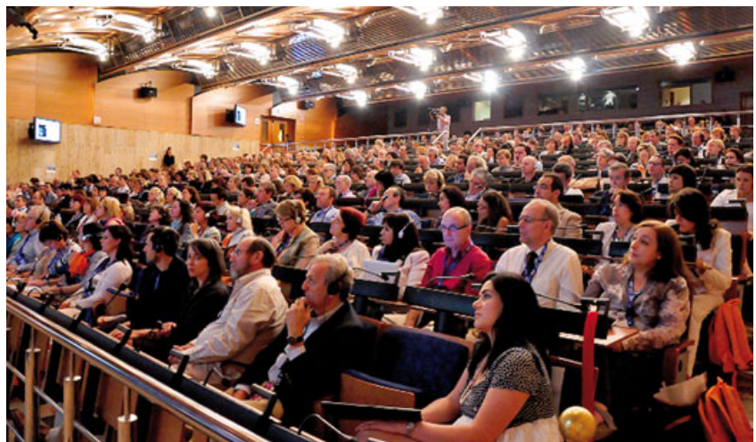
Vista general del salón principal de la Conferencia.

to para Londres, que tendrá lugar en 2012. Y, por supuesto, los asistentes, muy solícitos, reclamaron más presencia femenina, más enfoques prácticos, y -una que ha vuelto a suscitar el agradecimiento desde ICF España-, que se imiten las “best practices” que Madrid 2011 ha llevado a cabo en el desarrollo de la Conferencia.