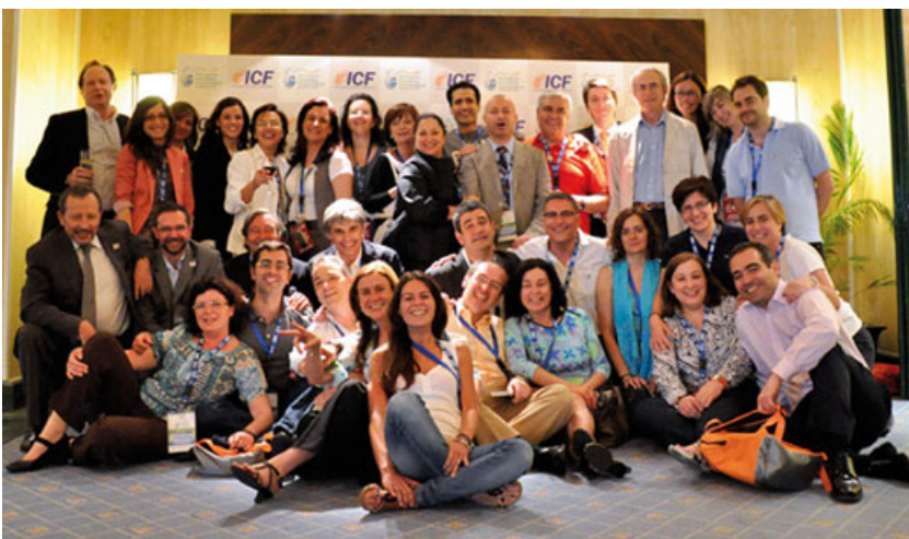
Los socios voluntarios en la organización de la Conferencia.

Los organizadores de la Conferencia también preguntaron, y al término de la misma se solicitó a los asistentes